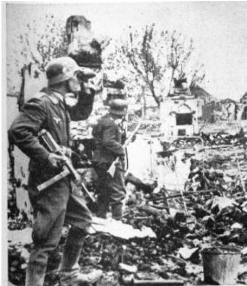
Der Führer eines Flak-Kampftrupps erkundet Widerstandsnester.