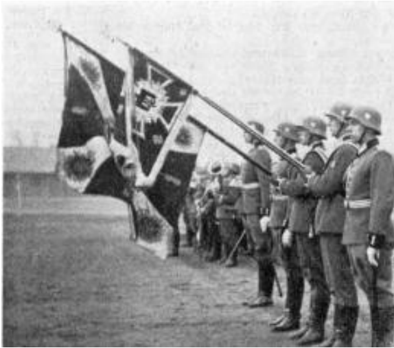
Die Fahngruppe des Pionier-Bataillons (mot.) 41 auf Herzogsacker in Königsberg. Als motorisierte Einheit führte das Bataillon eine Standarte; die Fahne hinter ihr ist das Ehrenzeichen des früheren samländischen Pionier-Bataillons Nr. 18, dessen Tradition das motorisierte Bataillon führte.