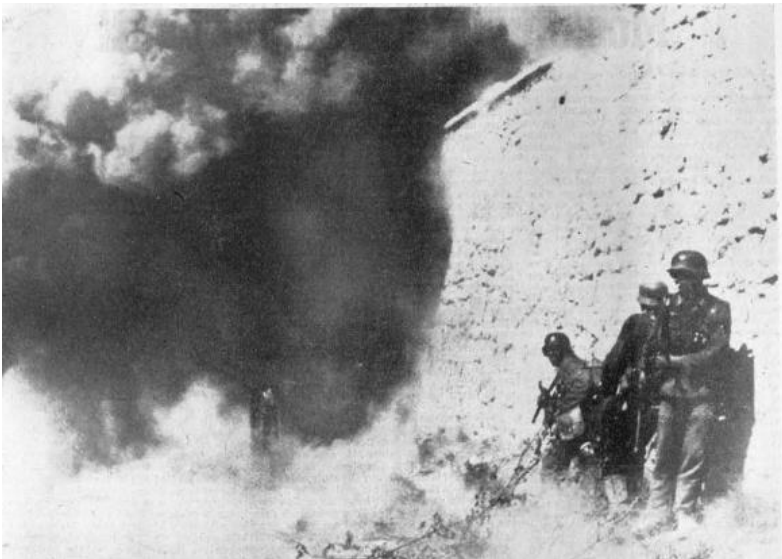
Das Bild entstand beim Kampf um eine russische Stadt.

Diese Fotos sind an verschiedenen Frontabschnitten im Osten aufgenommen. Aus Gründen der Geheimhaltung durfte während des Krieges der Truppenteil nicht angegeben werden. Es ist daher nicht möglich, die Divisionen zu benennen, deren Männer hier im Einsatz abgebildet sind.