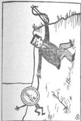
(„Die Tat“, Zürich) Frankreichs Währung am Abgrund Laniel: „Ja, wenn wir den Dollar nicht als Rettungsanker hätten“.