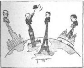
(„Weltwoche“, Zürich) Balance halten! Churchill verhandelt auf „höchster Ebene“.