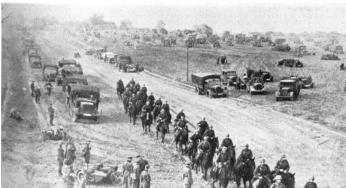
Eine Schwadron marschiert auf der Rollbahn