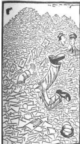
(„De Telegraaf“, Amsterdam) Frankreichs Post streikt Jean sucht seinen Liebesbrief!