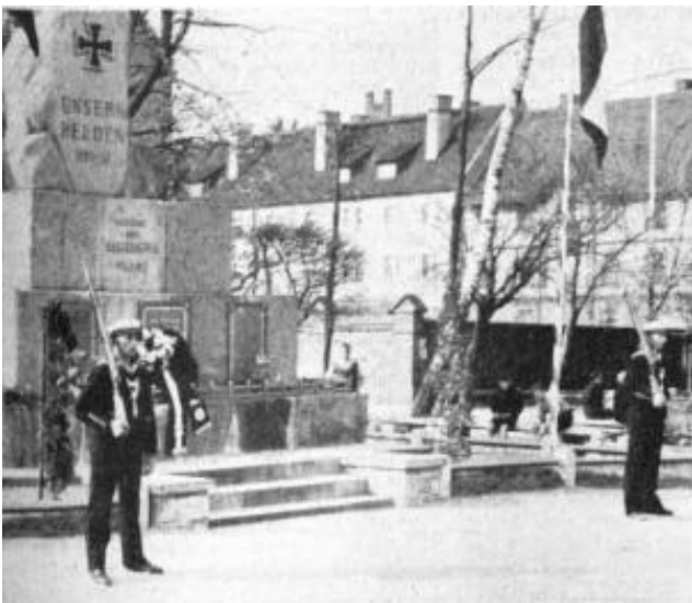
Matrosenwache vor dem Marine-Ehrenmal in Pillau.

Es ist nur recht und billig, wenn wir auch unter den so grundlegend veränderten Verhältnissen heute noch jener so eng mit ihrer Heimat verwachsenen Regimenter gedenken. Ging doch aus ihnen der größte Teil aller ostpreußischen Truppen hervor, und ihre Überlieferungen wurden vom Hunderttausend-Mann-Heer und später von den neuen Regimentern nach 1935 getreulich gepflegt. Feierlich wurden vor zwanzig Jahren ihre alten Fahnen in den Moskowitzersaal des Königsberger