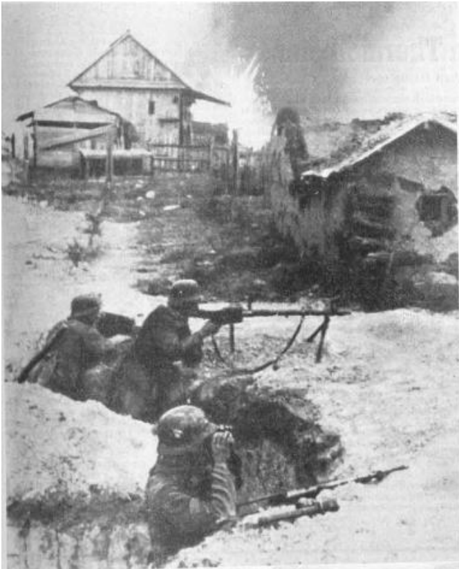
Vordere Grabenstellung der Infanterie.