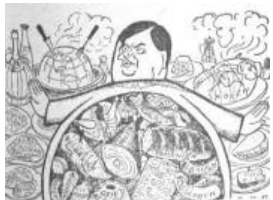
(„Weltwoche“, Zürich) Guter Magen „Russland hat keine Gebietsansprüche“.