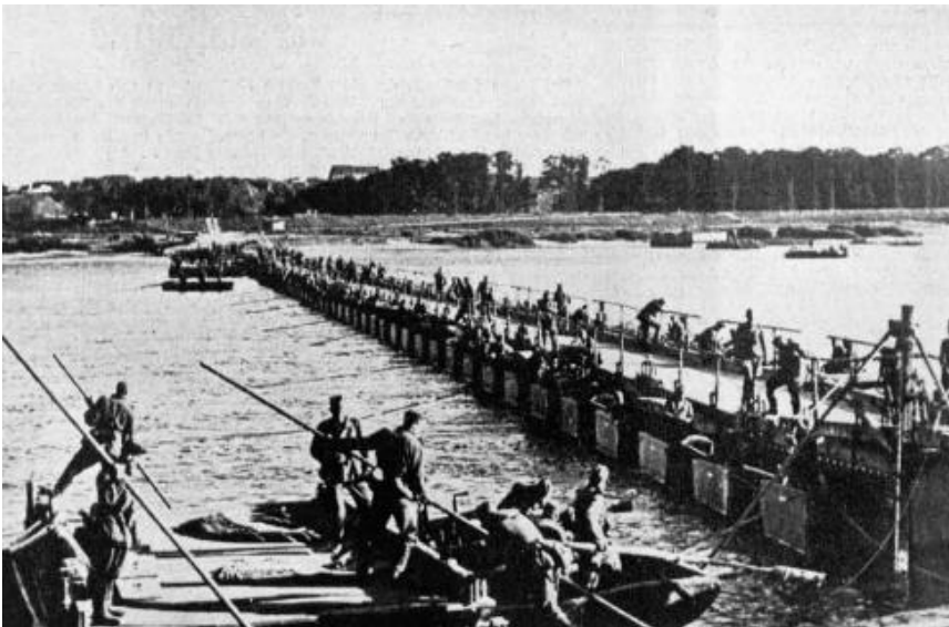
Von Pionieren geschlagene Pontonbrücke in Polen.