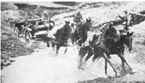
Granattrichter sind kein Hindernis für die Feldartillerie