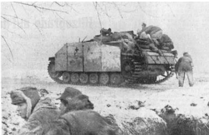
Panzergranadiere in der Winterkombination. Besonders schätzte der Soldat die Filzstiefel, die selbst bei hohen Frostgraden die Füße warm hielten.