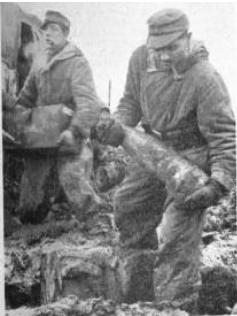
Kanoniere bergen nach einem feindlichen Feuerüberfall die durch aufgeworfene Erdklumpen verschüttete Munition.