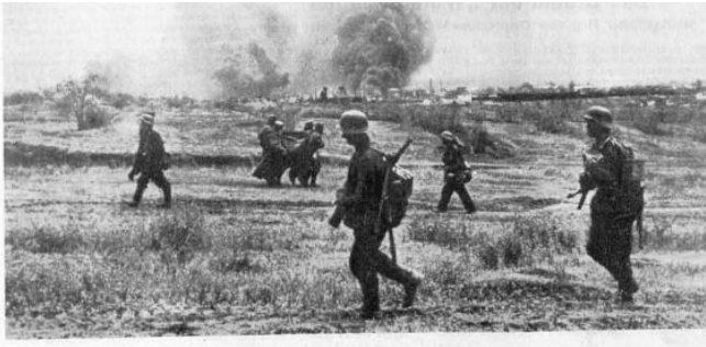
1941 Infanterie greift an. Leichtverwundete tragen einen schwer getroffenen Kameraden zum Verbandplatz. Granatfeuer schlägt in das Gelände. Im Hintergrund brennt eine Stadt.