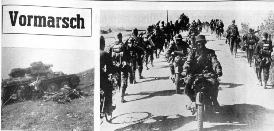
Panzergranadiere in Deckung hinter dem Kampfwagen