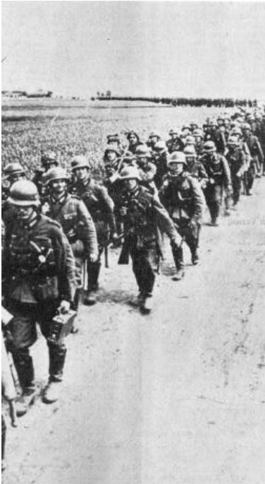
Die endlose Straße